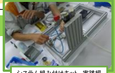
システム組み付けキット 実践編