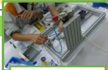
システム組み付けキット 実践編