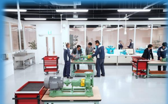
トレーニングセンターで実習による実践