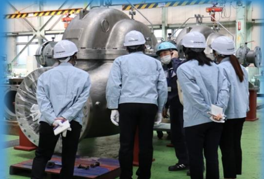
ポンプの製造現場を見学し、体感