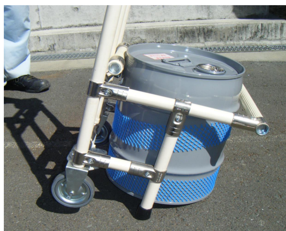
てこの原理 で原液缶を 楽 に傾ける