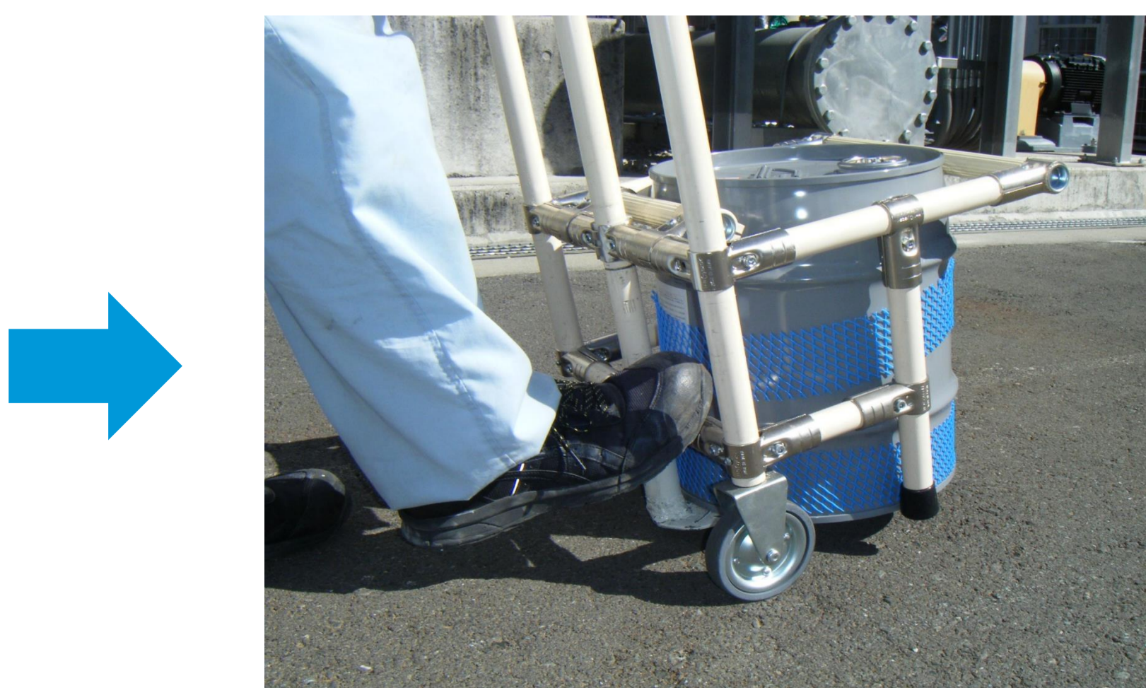
てこの原理 で原液缶を持ち上げる