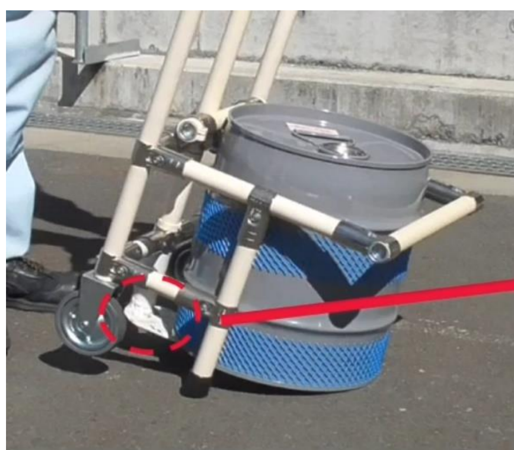
回転式ストッパー で原液缶を すくう