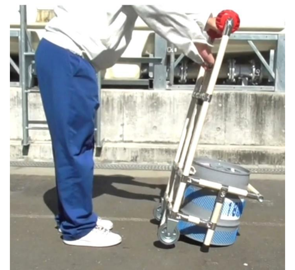
女性でも 楽 に運べるようになりました!