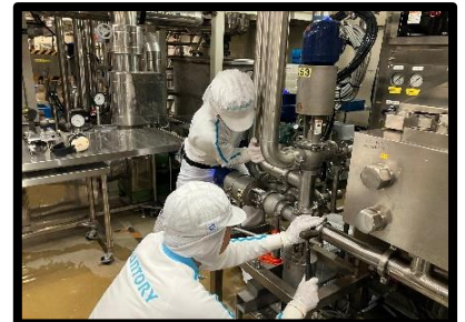
もう一人に押して（かなりの力必要） もらい、面を合わせ組付け