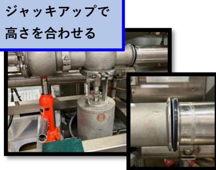
ジャッキアップで 高さを合わせる