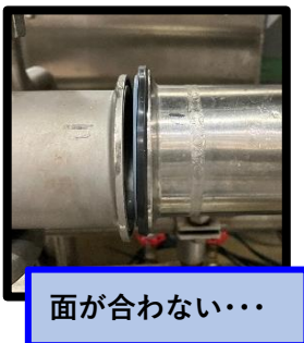
面が合わない・・・