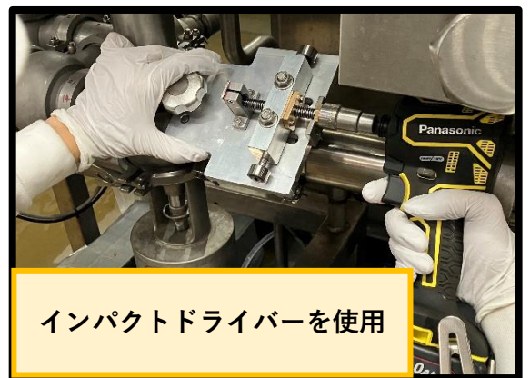
インパクトドライバーを使用