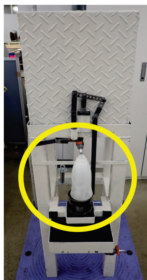
補充機にオイルセット