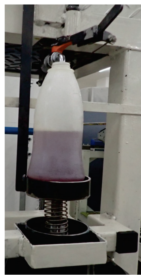
自動でオイル補充