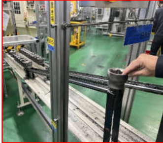
軸を下にして投入