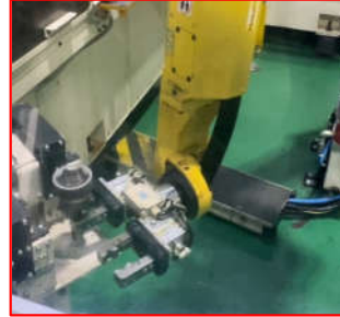
ロボットにて反転動作！！