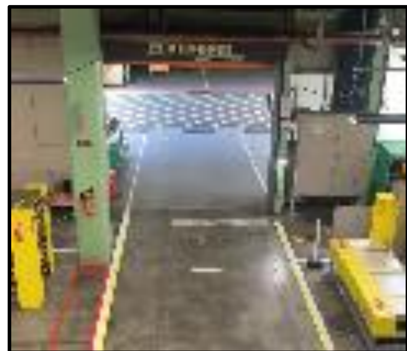
作業車用 シャッター入口