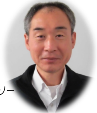
株式会社デンソー 生産調査部 TPM改革1室2課 担当課長