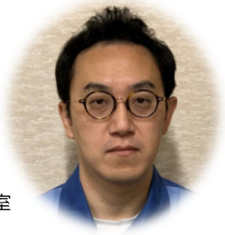
日本製鉄 株式会社 名古屋製鉄所 設備部 設備管理室 設備管理課 課長