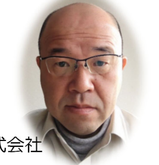
豊田合成株式会社 美和技術センター 生産調査部 モノづくり推進室 GL