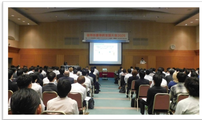
写真2 発表会場の様子

本大会では、3会場に分かれて各事例をご発表いただきました。全国から選抜された改善事例は生産・保全現場の困りごとや課題に果敢に挑んだ先進的な事例となっており、参加者の方は熱心に聴講していました。発表後の質疑応答では自社の困り事解決に活かそうと、多くの方が質問していました。