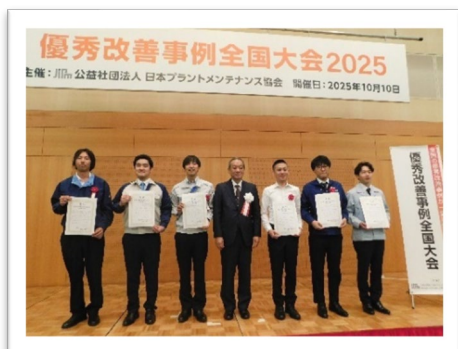
写真3 「大会特別賞」受賞者

発表後は参加者による投票を行い、6社6事例が「大会特別賞」に選出されました。表彰式では受賞者に賞状をお渡ししたのちに、記念撮影を行いました。受賞後のインタビューでは、自職場の仲間への感謝や改善への熱意をお話いただきました。