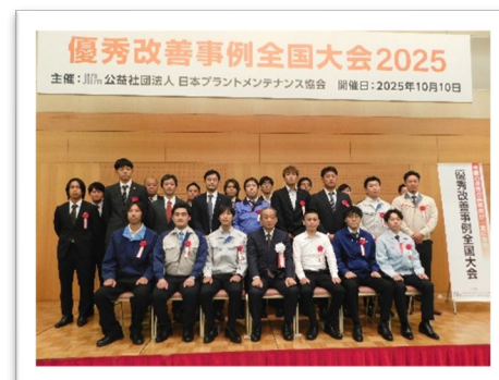
写真4 発表者で記念撮影