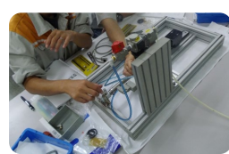
回路実習キット 入門編・実践編 機器分解キット 実践編 システム組み付けキット 実践編