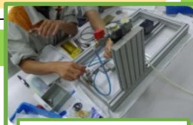
システム組み付けキット 実践編