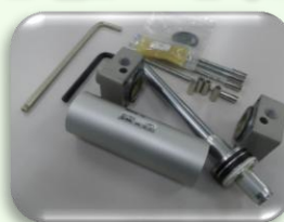
機器分解キット 実践編