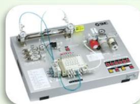
回路実習キット 入門編・実践編