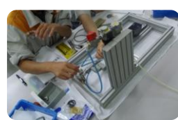
回路実習キット 入門編・実践編 機器分解キット 実践編 システム組み付けキット 実践編