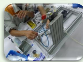
システム組み付けキット 実践編