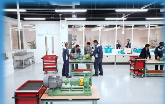
トレーニングセンターで実習による実践